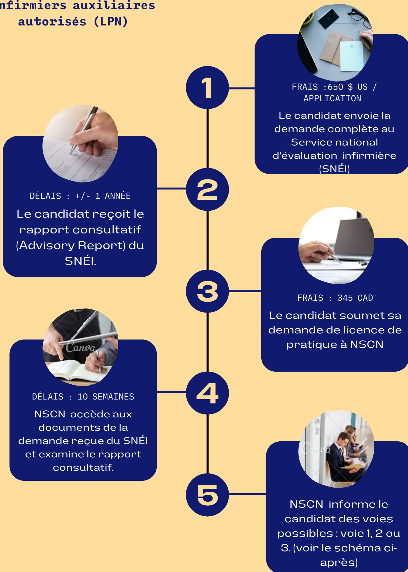
Schéma de la procédure d'équivalence pour les infirmiers auxiliaires autorisés (LPN)