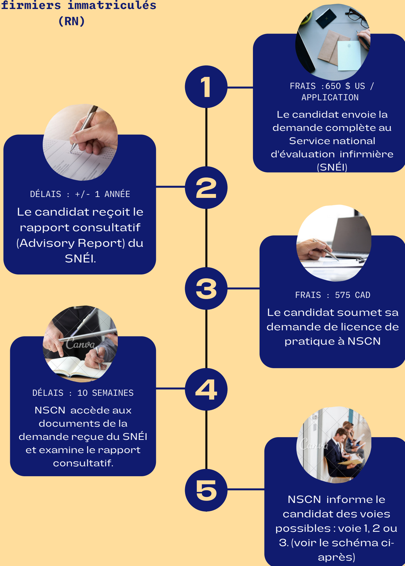
Schéma de la procédure d'équivalence pour les infirmiers immatriculés (RN)